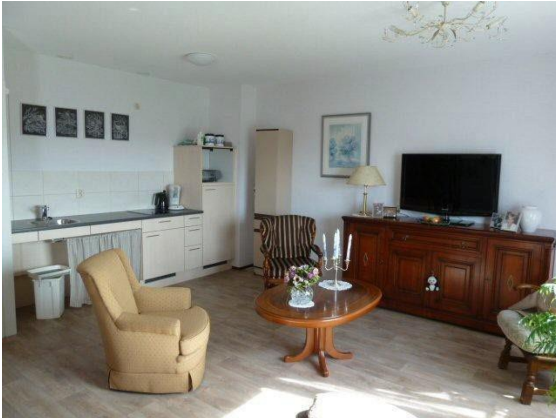
Woongedeelte 2-kamer appartement

De cliënten hebben de keuze om de maaltijden in het restaurant of in het eigen appartement te nuttigen. Er worden tal van activiteiten georganiseerd waar naar wens aan kan worden deelgenomen.